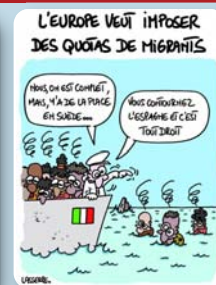
Dessin de Lasserpe