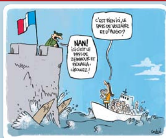
Soulié - Télérama