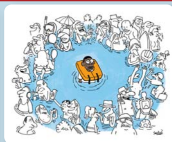
Soulié - Télérama