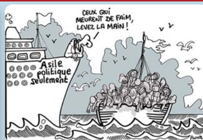
Plantu - Le Monde